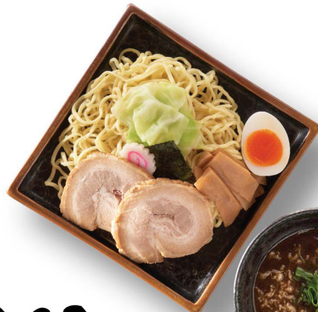
五行焦がし 醤油つけ麺 $98 GOGYO Kogashi Shoyu Tsukemen