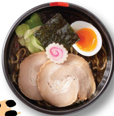
五行 焦がし味噌 GOGYO Kogashi Miso $128