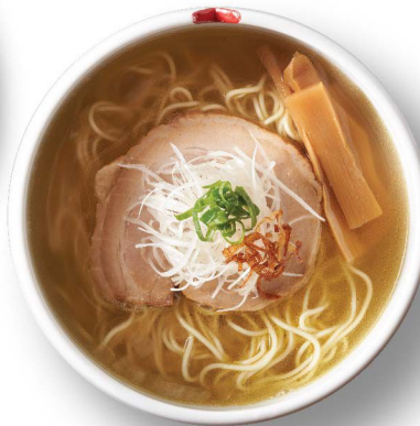
淡麗塩 Tanrei Shio $108