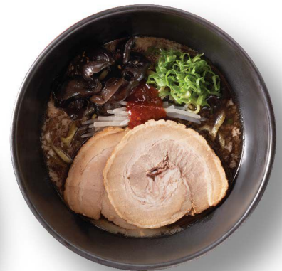
黒 $108 Kuro